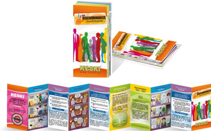
Dépliant Les Discriminables