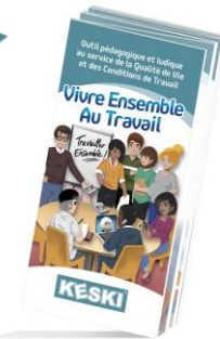
Le dépliant Vivre Ensemble Au Travail