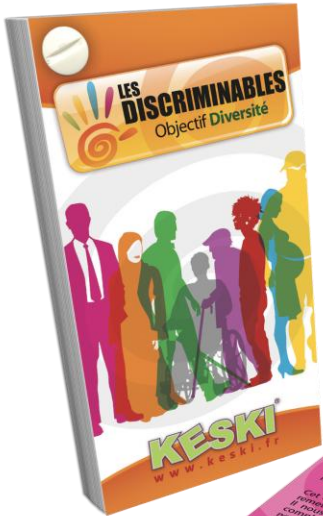
Le jeu de cartes Les Discriminables

Pour remercier les collaborateurs de leur participation et prolonger la sensibilisation