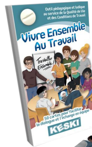
Le jeu de cartes Vivre Ensemble au Travail